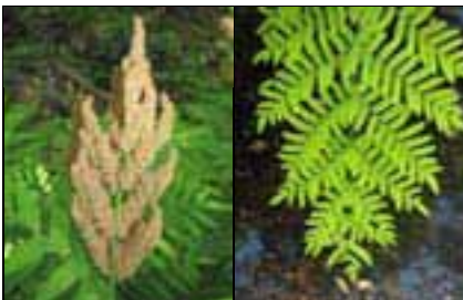
Panícula d'espòrangis / Fronda estèril

Planta herbàcia amb tiges subterrànies de les quals surten fulles grans, amb un pecíol molt llarg i dividides dues vegades. Es diferencien fulles fèrtils i fulles estèrils, les primeres portadores d'espòrangis globulosos agrupats a la part apical.