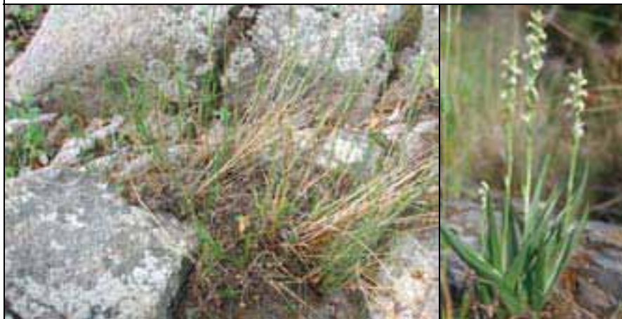
Aspecte general de l'hàbitat, a la llera del Riu Daró/ Port general